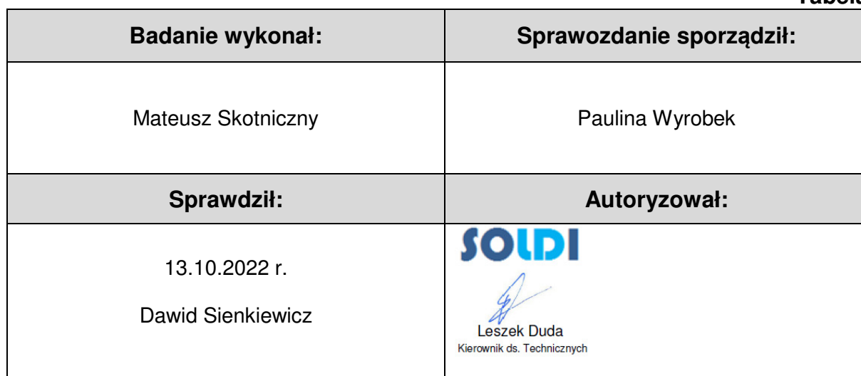
Tabela nr 6

Stwierdzenia zgodności dokonano na podstawie zasady podejmowania decyzji i wymagań zawartych w załączniku do Rozporządzenia Ministra Klimatu z dnia 17 lutego 2020 r. w sprawie sposobów sprawdzania dotrzymania dopuszczalnych poziomów pól elektromagnetycznych w środowisku [Dz. U. 2020, poz. 258, Dz. U. 2022, poz. 1121].